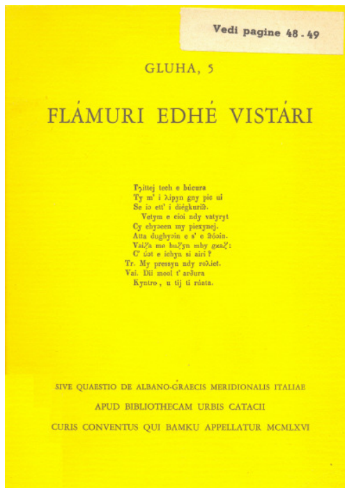
Fig. 2 - Copertina di Flámuri edhé Vistári (1966)

elvetiche. La necessità di rendere l' arbyresh locale lingua alta, un codice linguistico orale da essere travasato finalmente su carta ripropone al quasi settantenne Gangale la sfida di una scelta grafica per l' arbyresh . Se a Schrans con la popolazione aveva tradotto in sottosilvano (fissandone l'ortografia) un capitolo del Vangelo di Marco (Iannino 1999:53) in Calabria egli sembra operare autonomamente sulla scorta di una formidabile testimonianza scriptoria che partendo dalla fine del 1500 risale per giungere a nomi prestigiosi e a contesti progressisti della cultura arbëreshe dell'Ottocento, egli rivolge con sicurezza lo sguardo a Girolamo De Rada e al Congresso Linguistico di Corigliano Calabro (1895) e da ultimo al cavaliere Anselmo Lorecchio, proprietario e direttore del settimanale La Nazione Albanese , ben inserito negli ambienti politici romani e punto di riferimento anche di là dell'Adriatico. La pedagogia gangaliana appare quindi già ben delineata in Flámuri edhé Vistári (1966) ed è lì che viene risolta contestualmente anche la questione linguistica, ma il quadro teorico di base giungerà a compimento soltanto dopo anni ed espresso nei dettagli in Lingua arberisca restituenda (1976) quando Gangale è ormai prossimo agli ottant'anni.