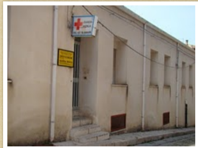
Ambulatorio Ausl, in Via Roma