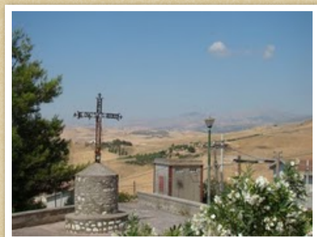
La Croce, nell'omonimo Spiazzo