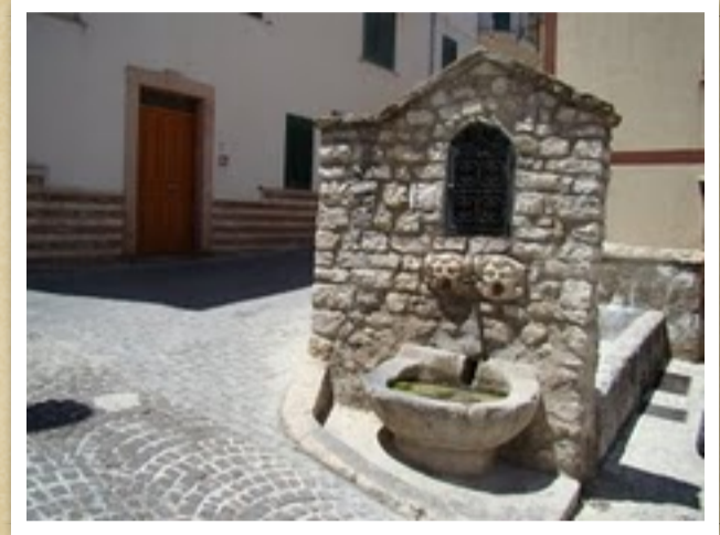
Fontana della Favara