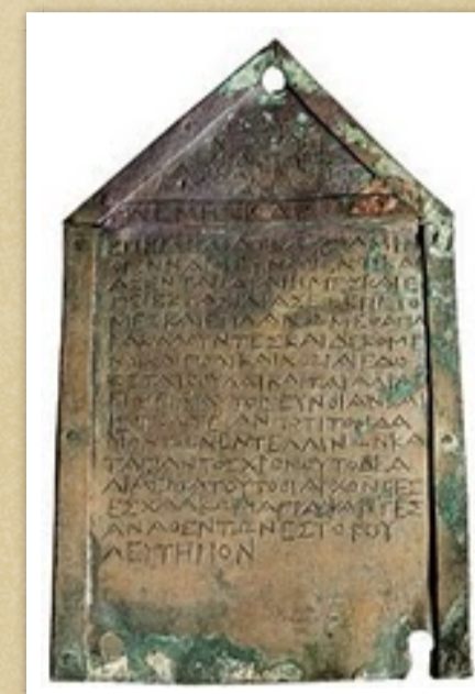
Una tavola dei decreti di Entella