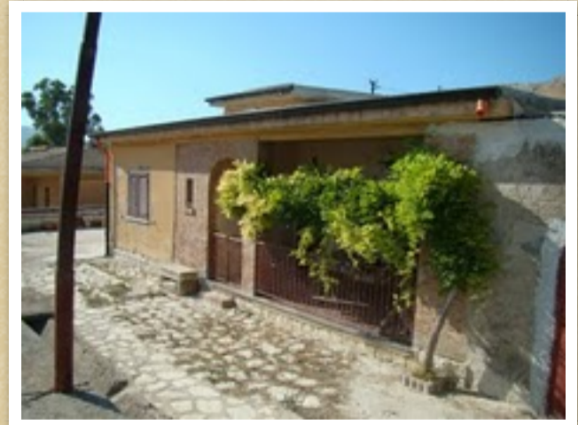
Casa ex Eras a B.go Roccella