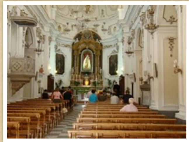
Interno della Chiesa Madonna-Favara