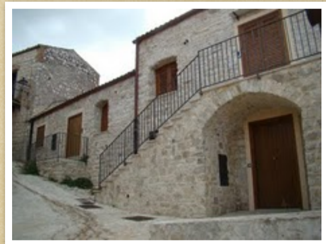
Case di Via Gassisi