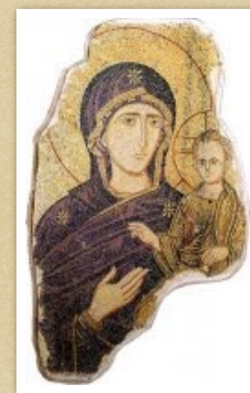
Madonna Odigitria di Calatamauro