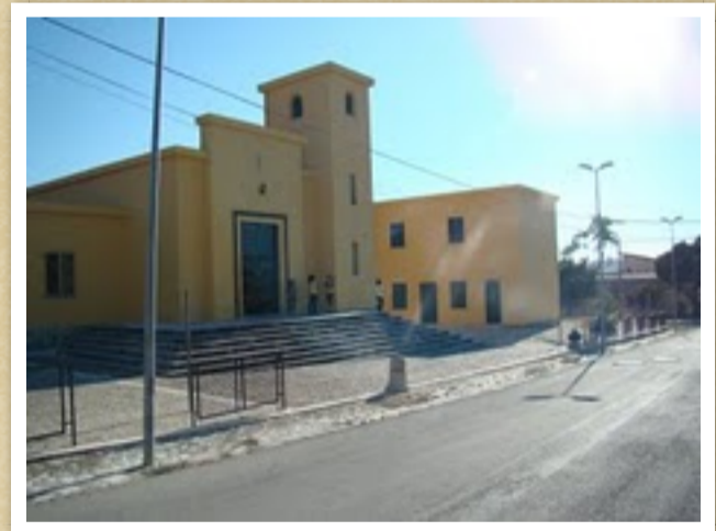
borgo Eras Piano Cavaliere: la chiesa