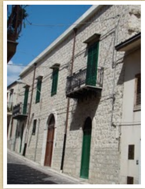
edificio prospiciente la via Morea