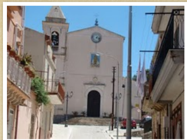
Chiesa rito romano della Favara