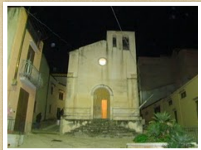
Chiesa -rito bizantino- di S. Rocco