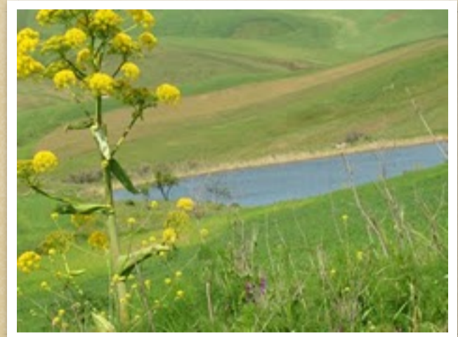
porzione diga Garcia, vista da Petrarò