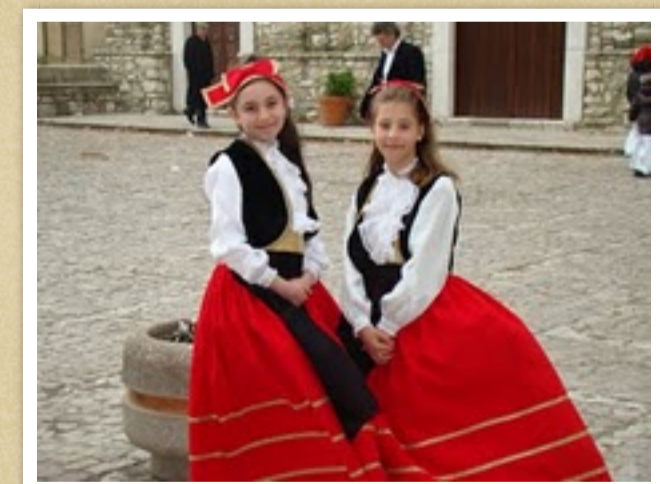
ragazze in costume arbreshe