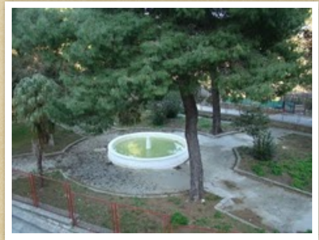
Biveri, nella villetta di spazzo Greco