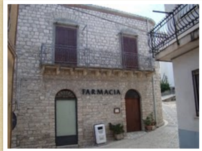
edificio in via Morea