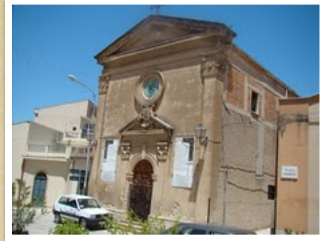
Chiesa rito greco Anime Sante - In piazza