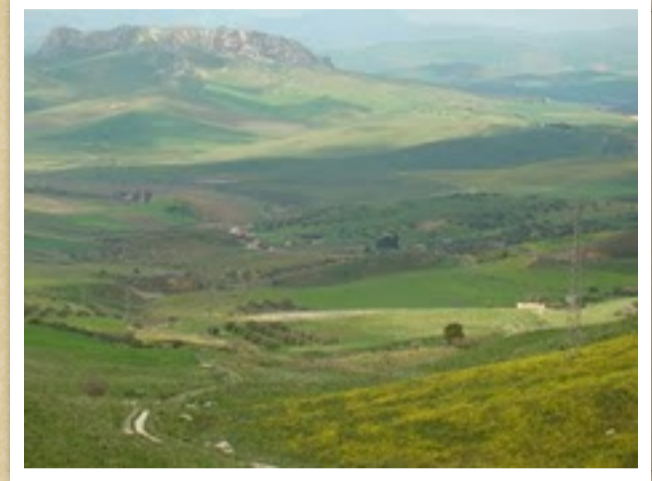
Vallata di Vaccarizzo e Rocca di Entella