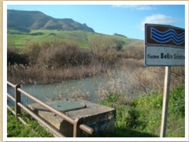
Fiume Belice nei pressi di Entella