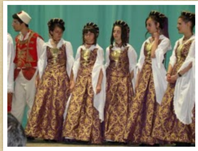
Costumi arbeshe di Contessa Entellina