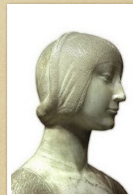
busto di Eleonora d'Aragona