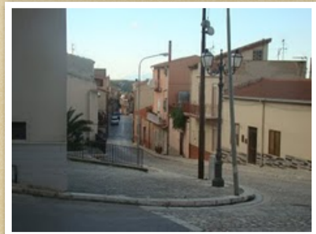
tratto della Via Morea