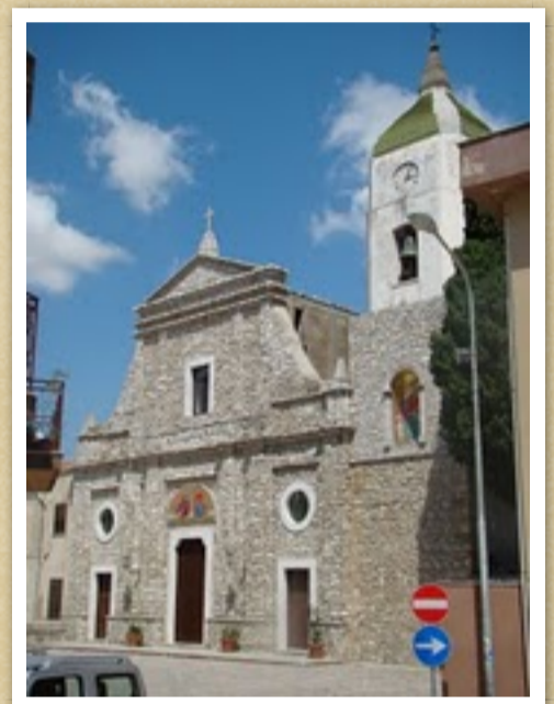
Chiesa rito greco SS. Annunziata