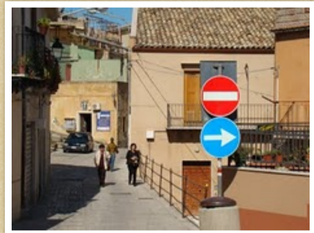
via Morea, vicino la piazza Umberto