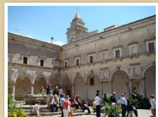
Santa Maria del Bosco di