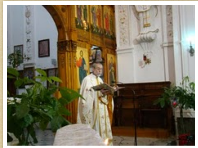
Il rito greco-bizantino