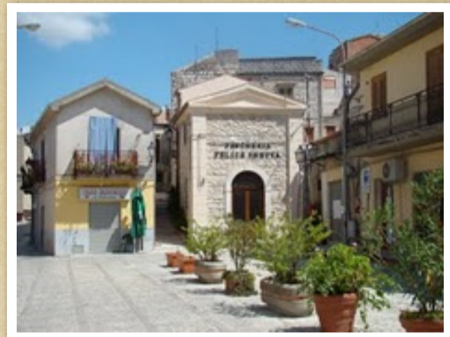
P.zza Umberto - Sfondo a destra l'antica pescheria